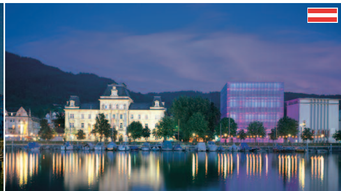
Bregenz am Bodensee Landeshauptstadt, Szene und Kulturmetropole am Bodensee. Freizeit- und Einkaufsstadt, historische Altstadt, das Kunsthaus, zahlreiche Theater und Galerien und das Casino bieten hier das ganze Jahr Programm.

Erlebnistage in der 4-Länder-Region am Bodensee