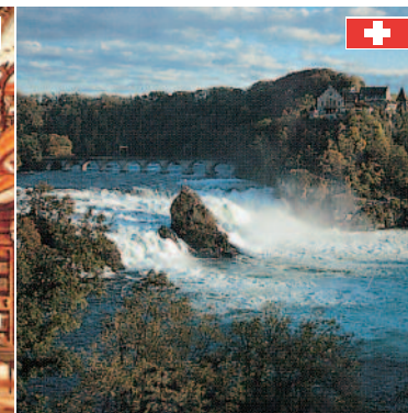
Rheinfälle Schaffhausen Europas größter Wasserfall – ein imposantes Naturschauspiel (ca. 120 km)