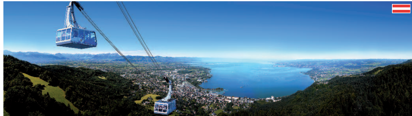
Blick vom Pfänder auf Bregenz, den Bodensee und das Rheintal