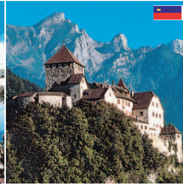
Schloß Vaduz das Wahrzeichen Liechtensteins, Residenz des regierenden Fürsten (ca. 55 km)