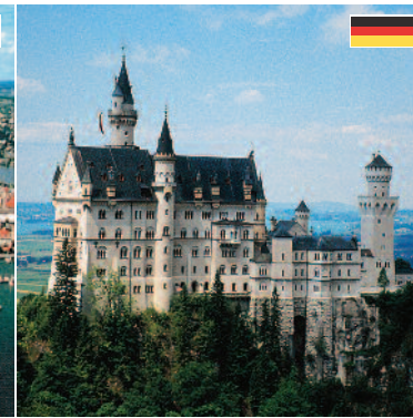
Schloß Neuschwanstein Märchenschloss von König Ludwig II. von Bayern in einmalig idyllischer Lage. (ca. 75 km)