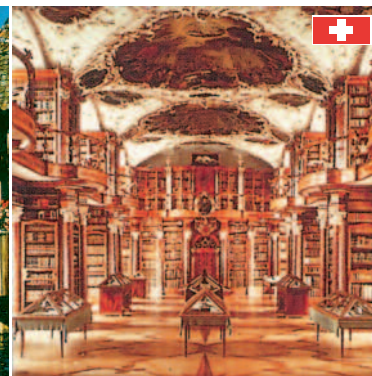
Stiftsbibliothek St. Gallen Eine der grössten und ältesten Klosterbibliotheken der Welt. (ca. 40 km)