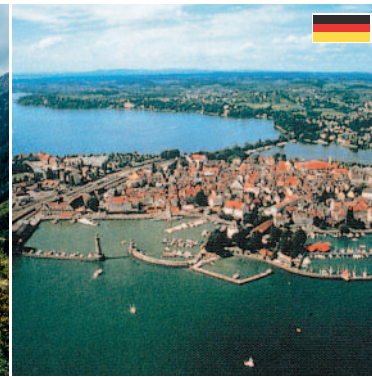
Insel Lindau Sehr gut erhaltene mittelalterliche Altstadt mit der berühmten Hafeneinfahrt. (ca. 10 km)