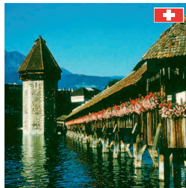
Lucern Was immer Sie von einer einzigartigen Stadt erwarten, Lucern enttäuscht Sie nicht. (ca. 180 km)