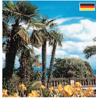
Insel Mainau Die Blumeninsel im Bodensee. Ein Ausflug zur Blumeninsel Mainau lohnt sich zu jeder Jahreszeit. (ca. 70 km)