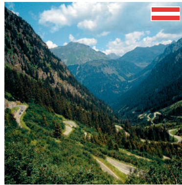
Silvretta Hochalpenstraße Eine der schönsten Gebirgsstraßen der österreichischen Alpen. Auf Passhöhe liegt der Silvretta Stausee. (ca. 100 km)

Erlebnistage in der 4-Länder-Region am Bodensee