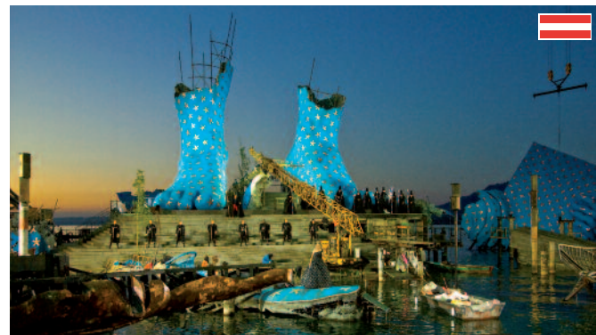
Bregenzer Festspiele (Juli / August) 2010 ist auf der weltgrößten Seebühne Giuseppe Verdis AIDA mit der grandiosen Kulisse des Bodensees als Spiel auf dem See zu sehen. 2011 wird die Oper Andrea Chénier von Umberto Giordano aufgeführt.

Ihr idealer Standort für attraktive Ausflüge zu vielfältigen Sehenswürdigkeiten in der 4 Länder-Region – ob zu Fuss, Fahrrad, Schiff oder Bus.