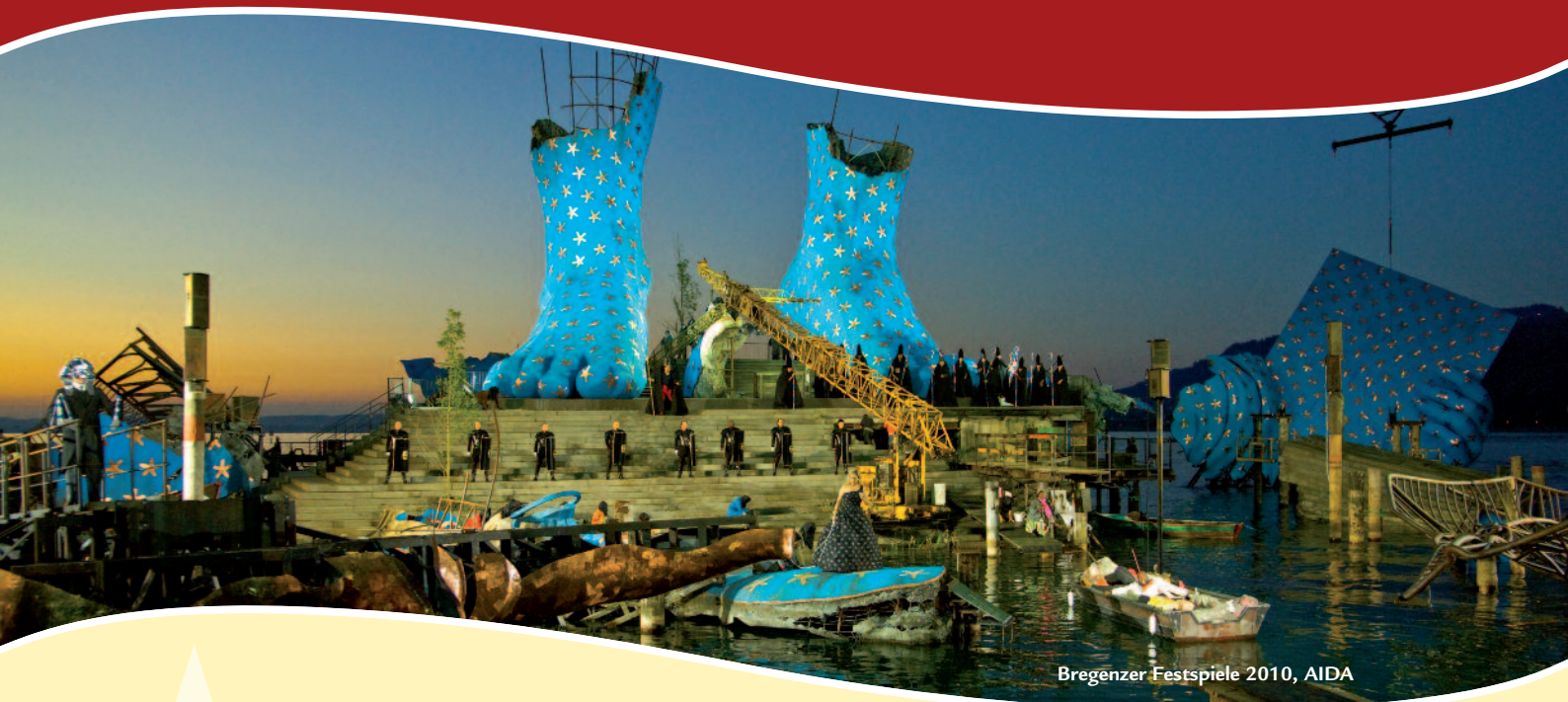
Bregenzer Festspiele 2010, AIDA