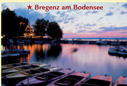
★ Bregenz am Bodensee