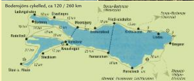
Bodensjöns cykelled, ca 120 / 260 km