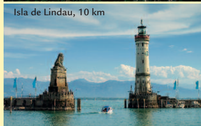
Isla de Lindau, 10 km