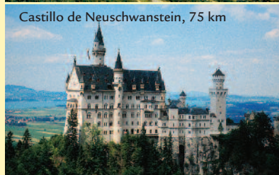
Castillo de Neuschwanstein, 75 km