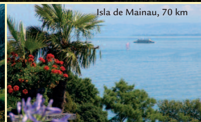
Isla de Mainau, 70 km