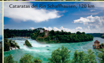
Cataratas del Rin Schaffhausen, 120 km