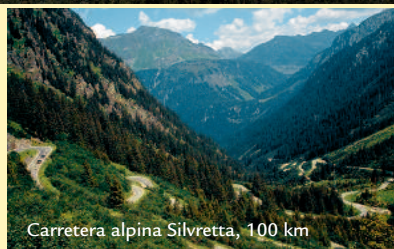
Carretera alpina Silvretta, 100 km