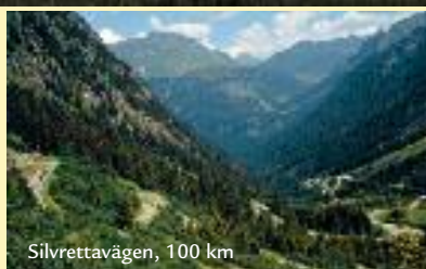
Silvrettavägen, 100 km