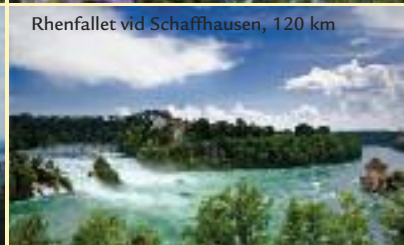
Rhenfallet vid Schaffhausen, 120 km