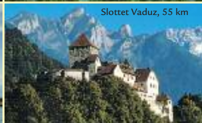
Slottet Vaduz, 55 km