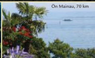
Ön Mainau, 70 km