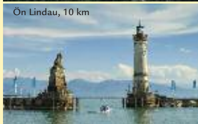
Ön Lindau, 10 km