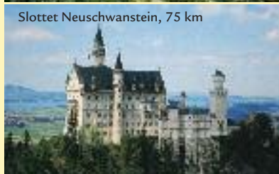
Slottet Neuschwanstein, 75 km