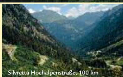
Silvretta Hochalpenstraße, 100 km