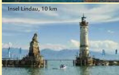
Insel Lindau, 10 km