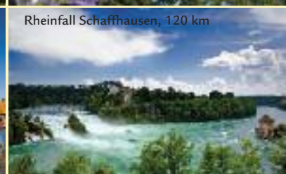
Rheinfall Schaffhausen, 120 km