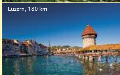
Luzern, 180 km