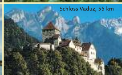
Schloss Vaduz, 55 km