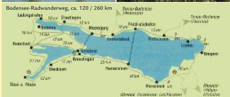
Bodensee-Radwanderweg, ca. 120 / 260 km