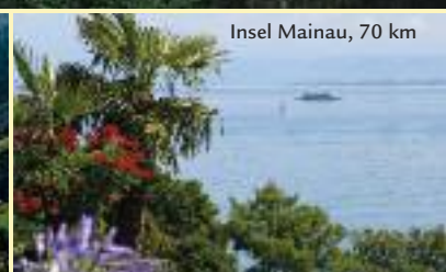
Insel Mainau, 70 km