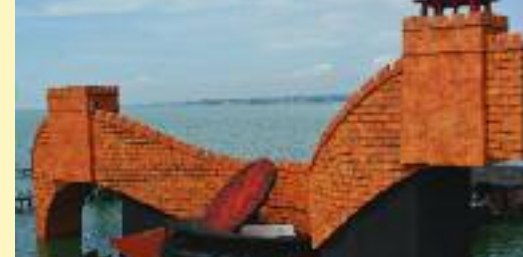
Bregenzer Festspiele „Turandot“ von Giacomo Puccini 2015/16

Ausführliche Informationen zu vielen Möglichkeiten unter: www.deutschmann-bregenz.at