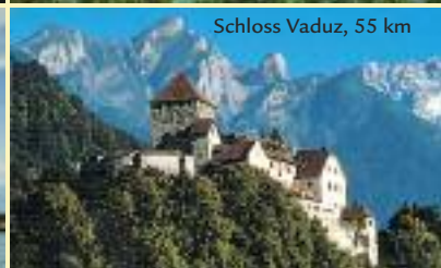
Schloss Vaduz, 55 km