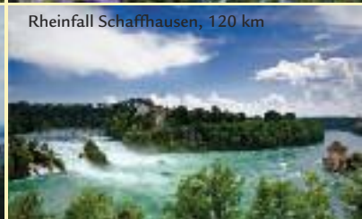
Rheinfall Schaffhausen, 120 km