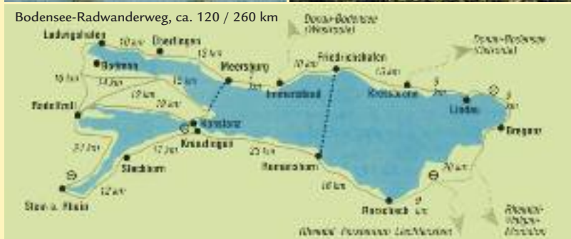
Bodensee-Radwanderweg, ca. 120 / 260 km