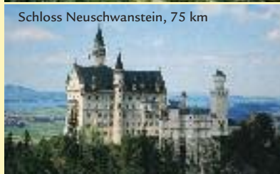
Schloss Neuschwanstein, 75 km