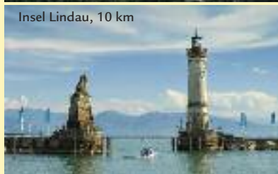
Insel Lindau, 10 km