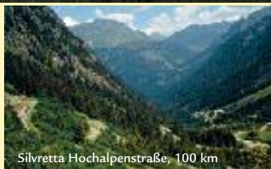
Silvretta Hochalpenstraße, 100 km