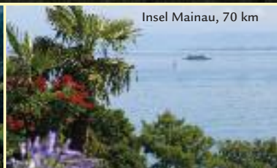
Insel Mainau, 70 km